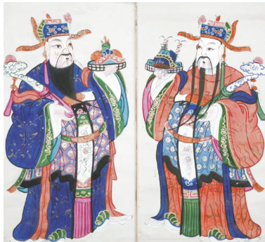
图6 相士加官门神 四川绵竹