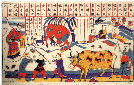
图8 春牛图 近代 山东潍县