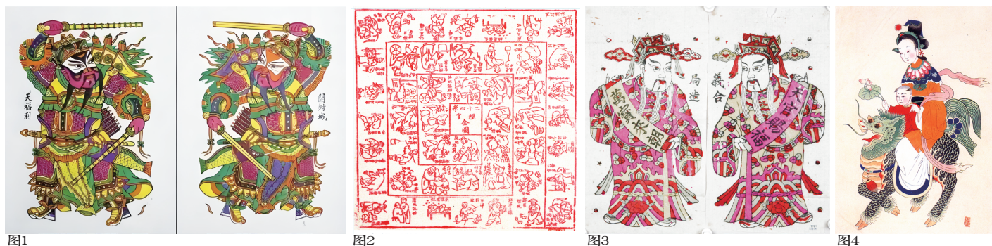
图1 门神 清代 开封朱仙镇 图2 二十四孝图 清代 四川绵竹 图3 天官赐福 万宝来朝 陕西凤翔 图4 麒麟送子 清代 山西临汾