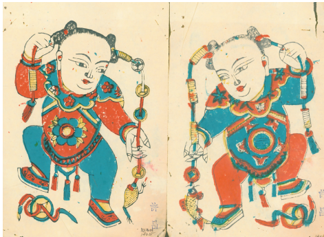
图7 刘海戏金蟾 清代 河南朱仙镇